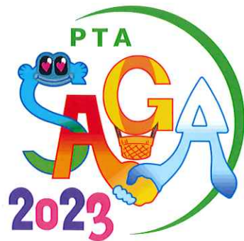
佐賀大会シンボルマーク

佐賀大会ではスローガンを「SAGAそう 子どもの未来 見直そう PTAの力」とし、PTAの存在意義を改めて見つめ直す機会とする。子供たちの現状とその環境をしっかりと見つめるとともに、未来のためにPTAが本来持っている力を今こそ見直していく必要がある。家庭・学校・地域の一体的なつながりをより強くし、より深化した組織の在り方とは何かを問う機会としたい。