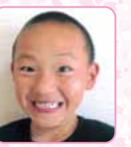
千代田中部小学校

ぼくは、一ねんせいになつたら、 たしざんのお べんきょうをがんばりま す。おにいちゃんみたい にかっこいい一ねんせい になりたいとおもいます。 がんばるぞ!!